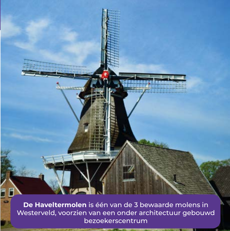
De Haveltermolen is één van de 3 bewaarde molens in Westerveld, voorzien van een onder architectuur gebouwd bezoekerscentrum