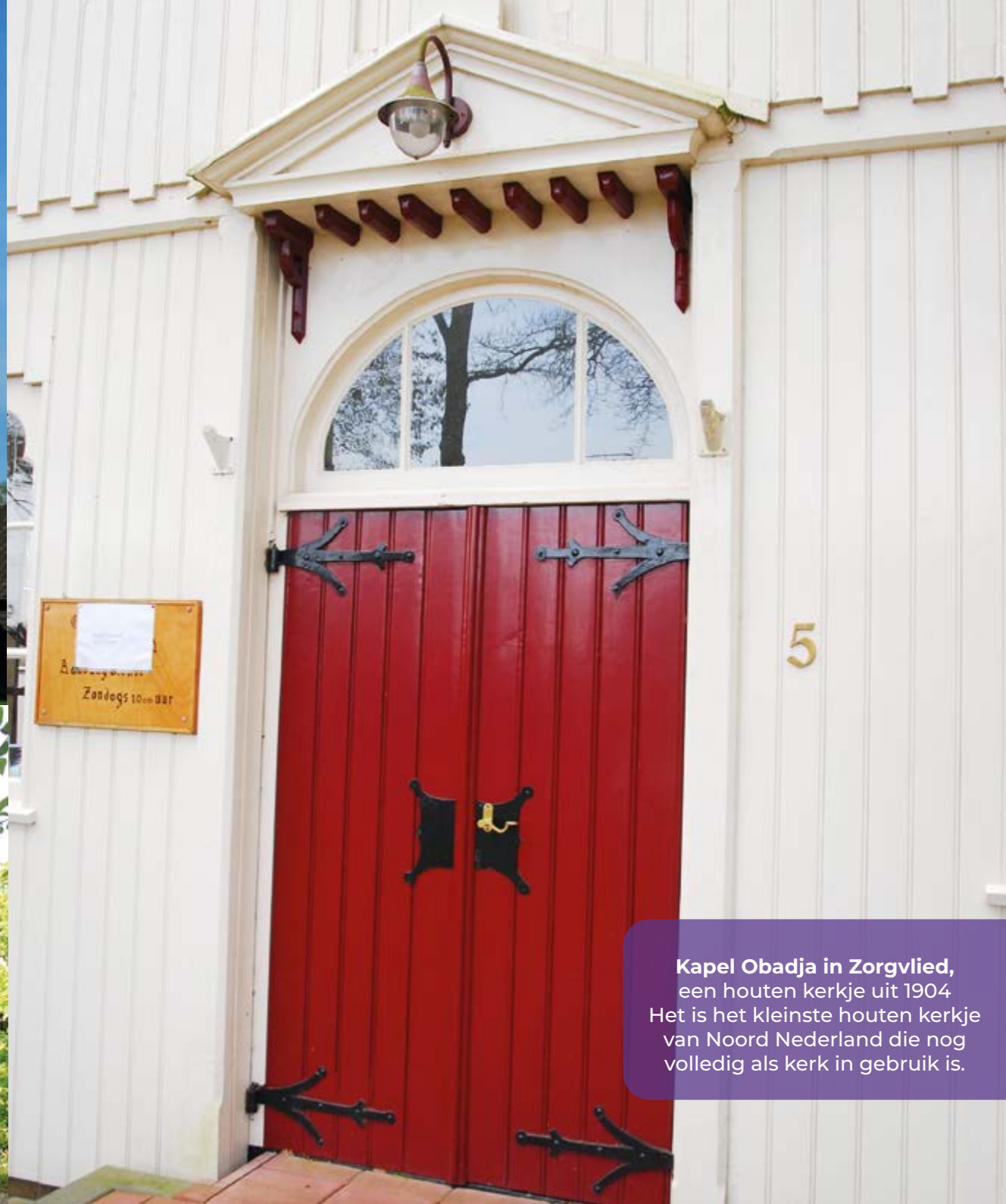
Kapel Obadja in Zorgvlied , een houten kerkje uit 1904. Het is het kleinste houten kerkje van Noord Nederland die nog volledig als kerk in gebruik is.