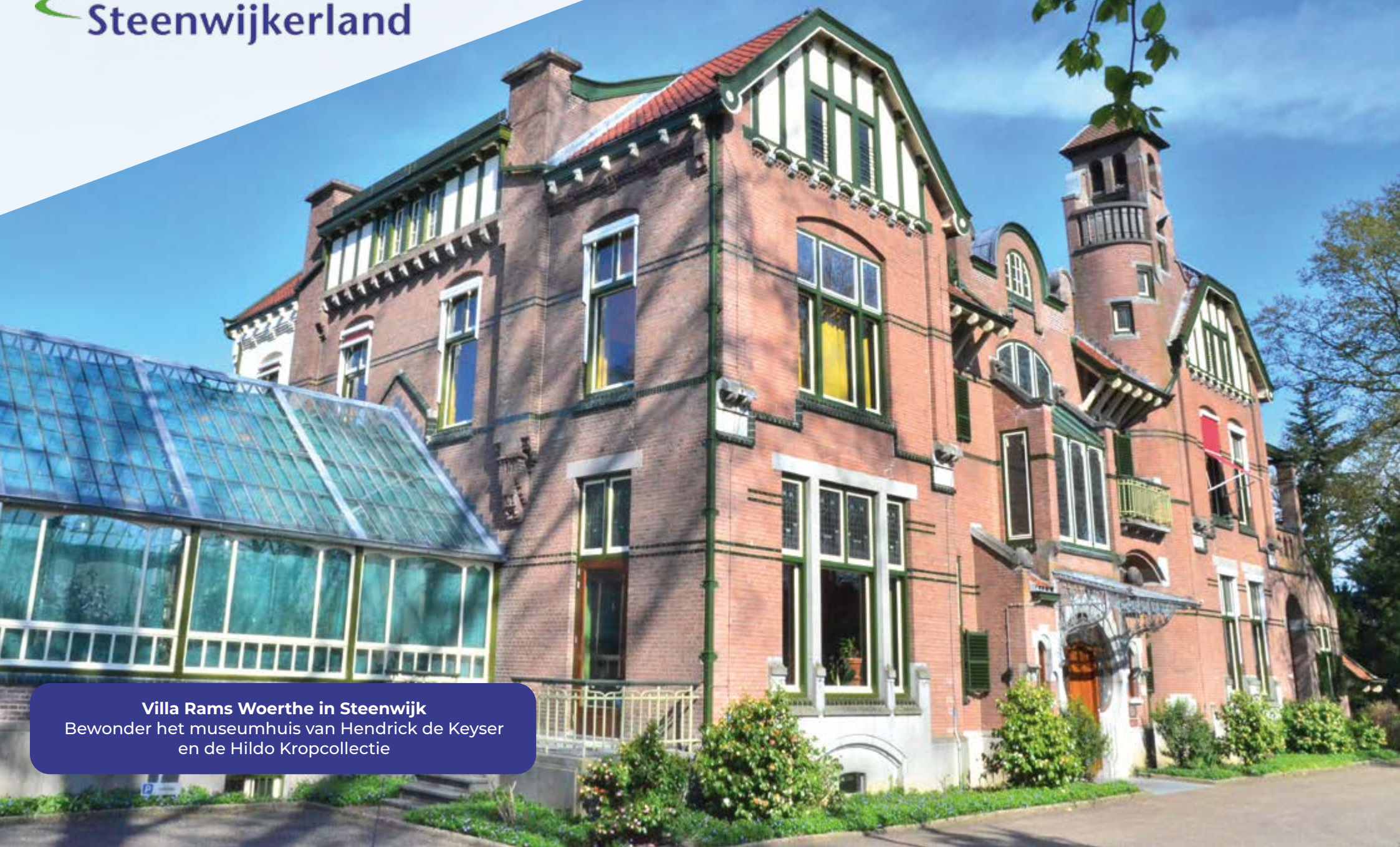
Villa Rams Woerthe in Steenwijk Bewonder het museumhuis van Hendrick de Keyser en de Hildo Kropcollectie