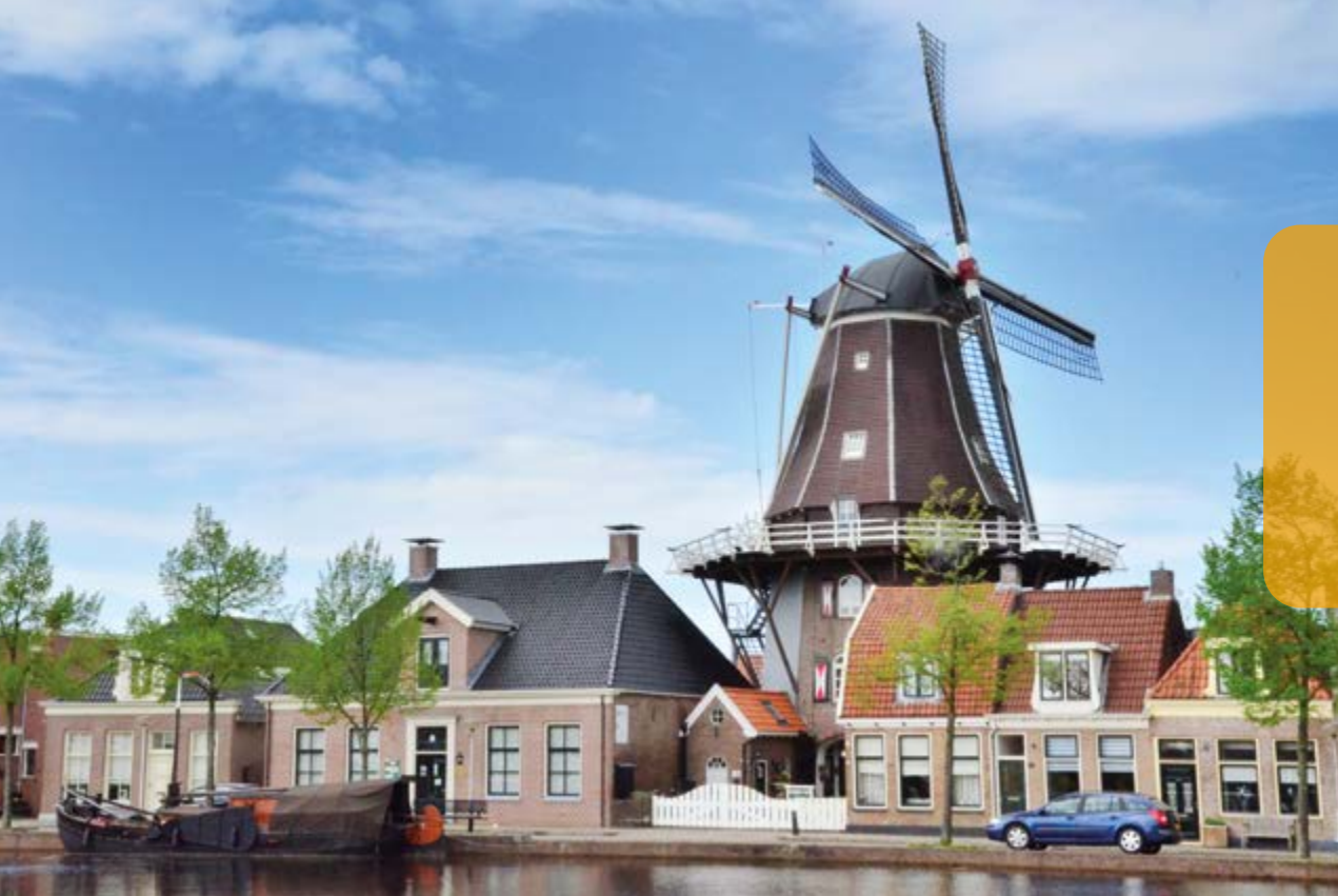
Molen De Vlijt Sluisgracht achtkantige houten stellingmolen uit 1859