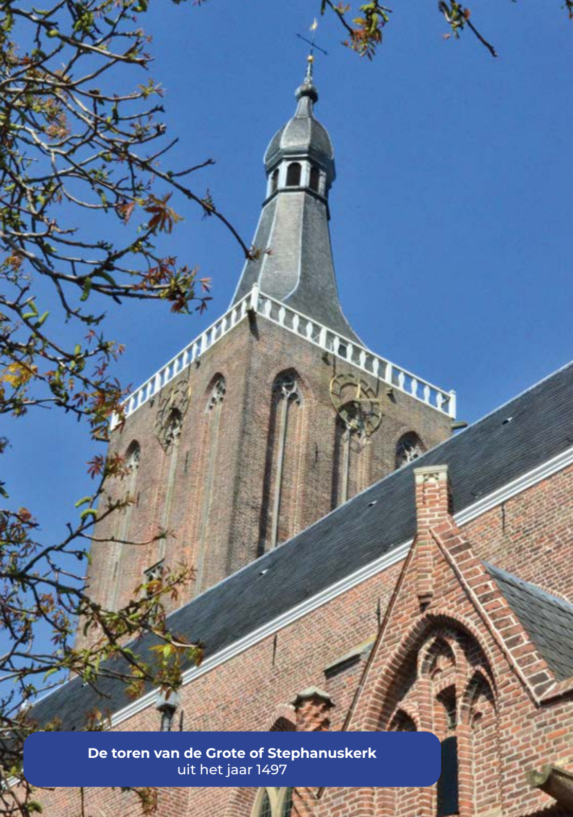
De toren van de Grote of Stephanuskerk uit het jaar 1497