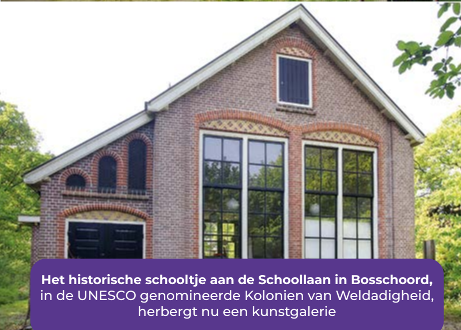
Het historische schooltje aan de Schoollaan in Boschoord , in de UNESCO genomineerde Kolonien van Weldadigheid, herbergt nu een kunstgalerie