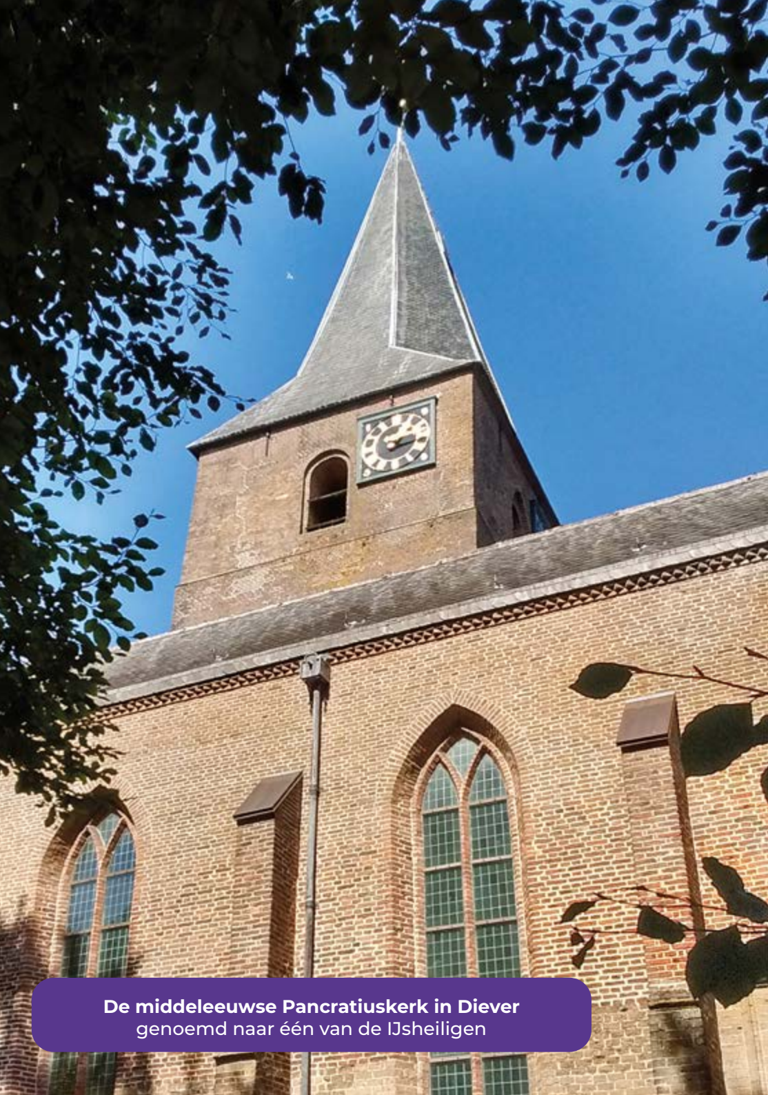
De middeleeuwse Pancratiuskerk in Diever genoemd naar één van de IJsheiligen