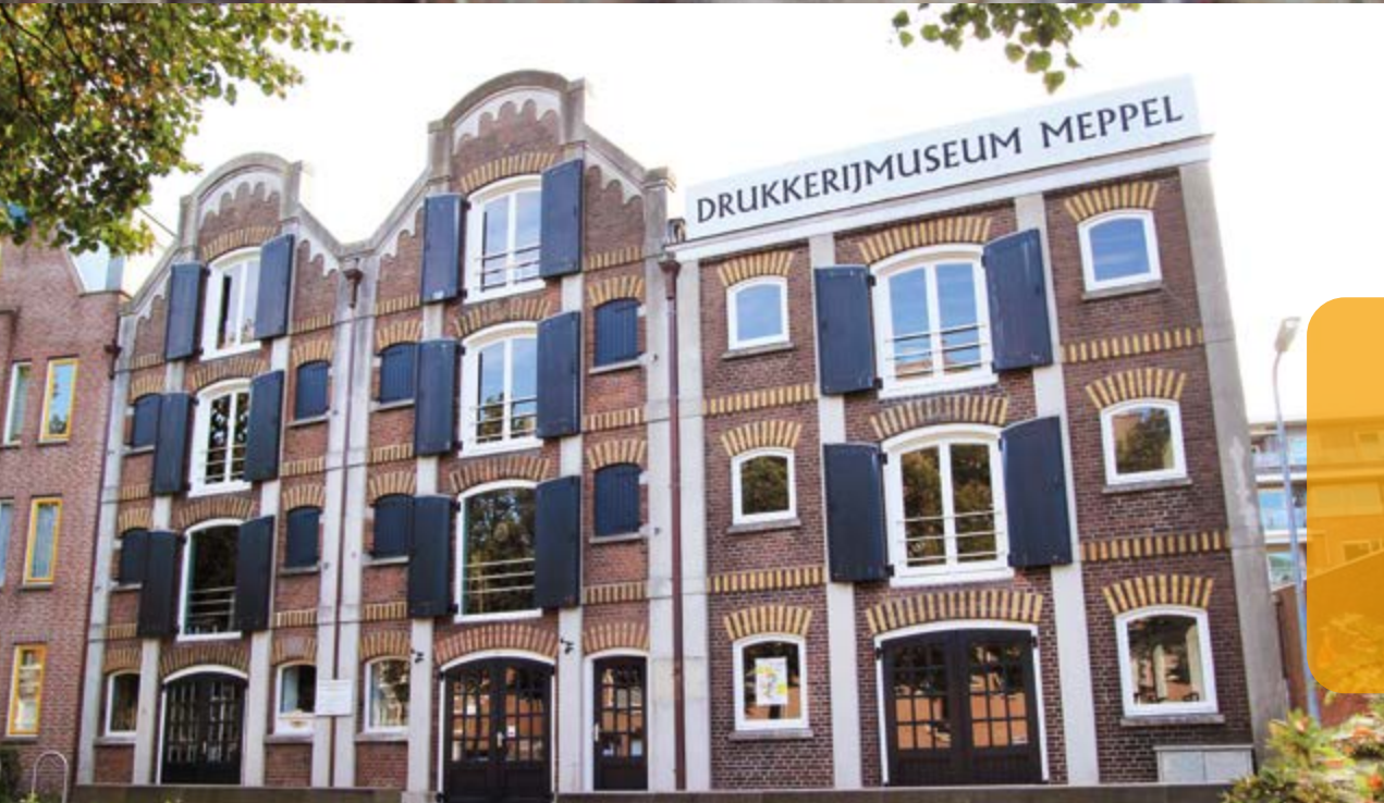
Drukkerijmuseum gevestigd in een monumentaal pakhuis uit 1885