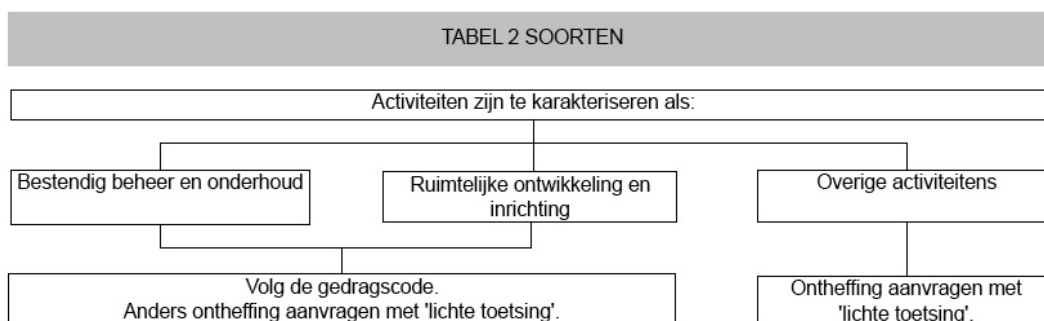
Schema 1.1 Overzicht beschermingsregime soorten van Tabel 2

Een ontheffingsaanvraag voor Tabel 2 soorten wordt getoetst aan het criterium 'doet geen afbreuk aan de gunstige staat van instandhouding 2 van de soort' (lichte toets).