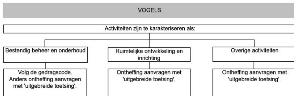
Schema 1.3 Overzicht beschermingsregime vogels

Voor werkzaamheden in het kader van ruimtelijke ontwikkeling en inrichting moet bij overtreding van de verbodsbepalingen voor vogels altijd een ontheffing worden aangevraagd. Deze ontheffingsaanvraag wordt onderworpen aan een uitgebreide toets.