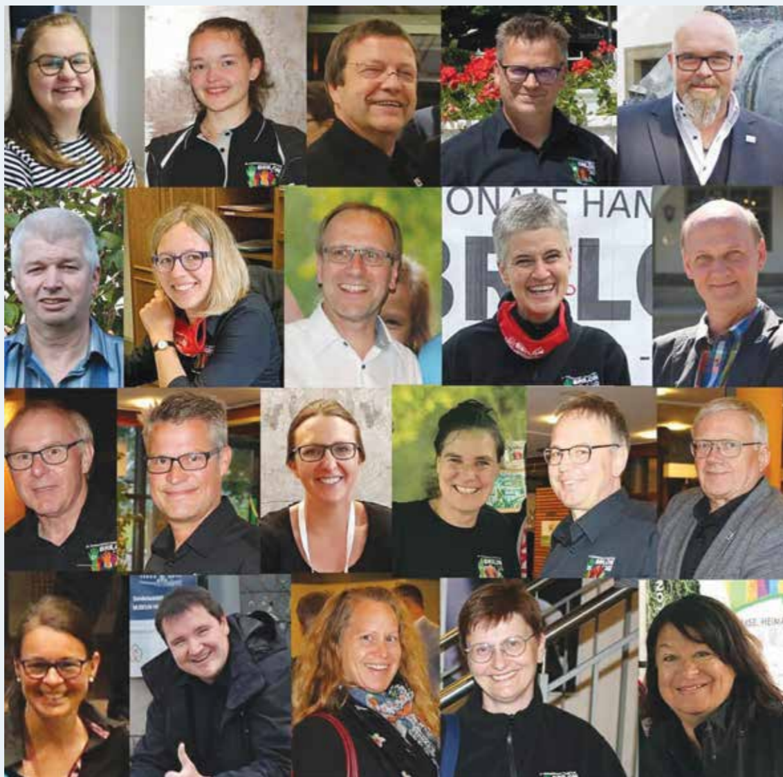
Het team van de Hanzedagen in Brilon.