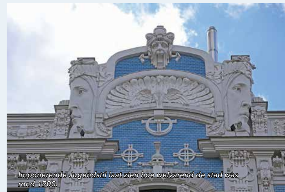
Imponerende Jugendstil laat zien hoe welvarend de stad was rond 1900.