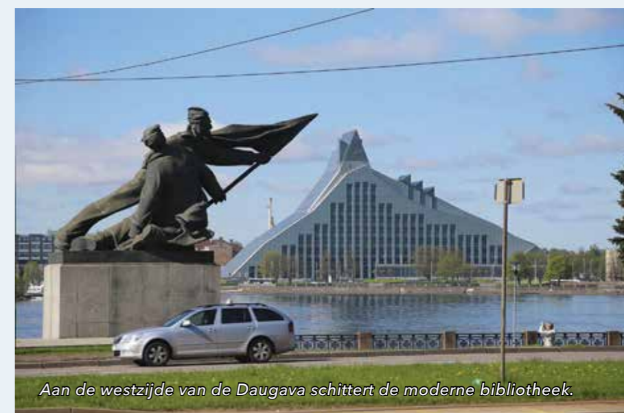
Aan de westzijde van de Daugava schittert de moderne bibliotheek.

De Internationale Hanzedagen van 2021 vinden plaats in Riga. Hoogzomer van 19 tot en met 22 augustus. De hoofdstad van Letland is met 630.000 inwoners de grootste stad van de Baltische staten. In 1990 telde de plaats nog 900.000 bewoners.