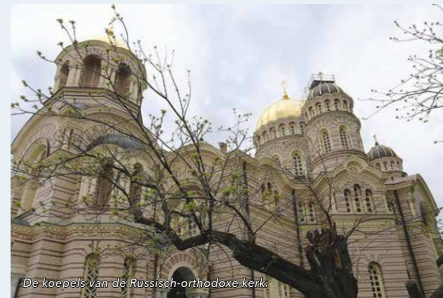
De koepels van de Russisch-orthodoxe kerk.