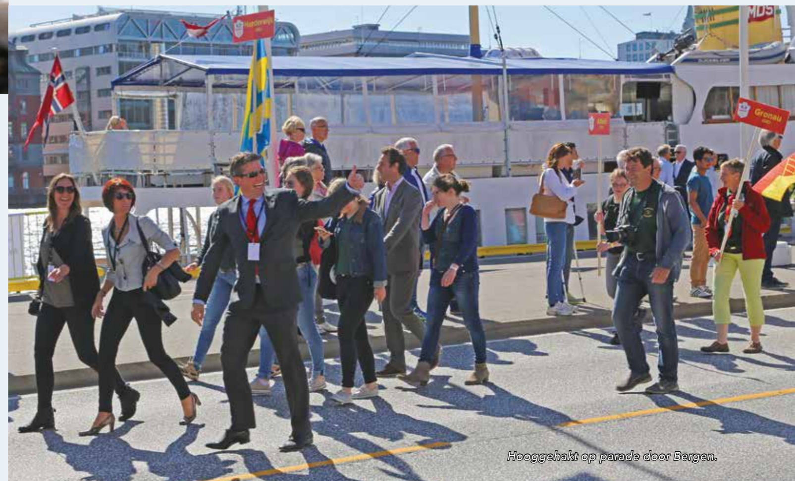
Hooggehakt op parade door Bergen.

toe." Andere bijzondere tochten gingen naar Bergen en Lübeck, mooie grote steden. "Kampen - heel goed georganiseerd - gaf weer een heel andere beleving. Je ging 's avonds gewoon naar huis en dat heb je anders niet. Een van de leuke dingen van de Hanzedagen zijn de ontmoetingen. Met bestuurders, met ambtenaren, met de jongeren. Gewoon, allemaal bij elkaar. En nog een keer internationaal ook. Brilon heeft dit jaar zijn uiterste best gedaan om binnen de mogelijkheden het beste van de Hanzedagen te maken. Kreeg veel aandacht via de sociale media. Maar dat haalt het toch niet bij de contacten en sfeer van de fysieke Hanzedagen."